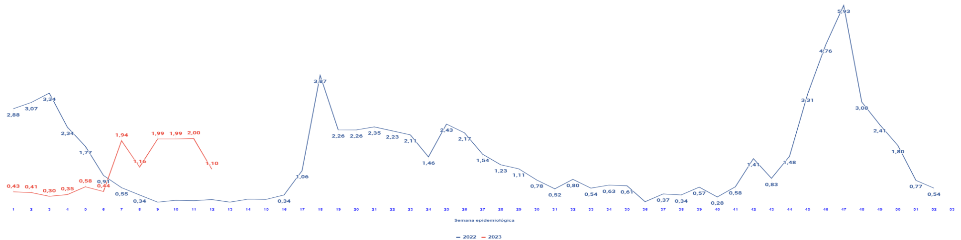
Gráfico 3. Média da taxa de contaminação* da covid-19 por semana epidemiológica em Palmas-TO, 2022 e 2023.

*O R_0 representa o número médio de pessoas suscetíveis que um indivíduo infectado pode contaminar com o SARS CoV-2.